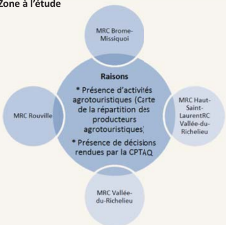
Répartition des producteurs agrotouristiques